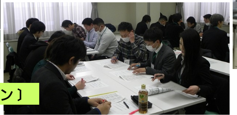
〔グループディスカッション〕