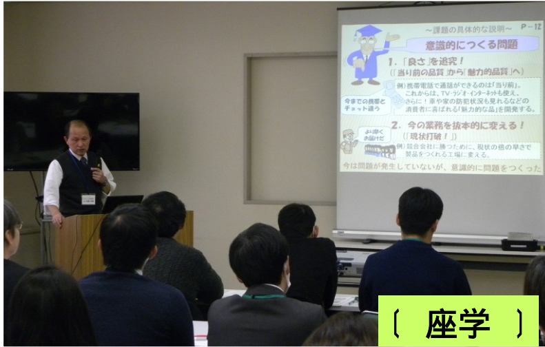
〔 座学 〕