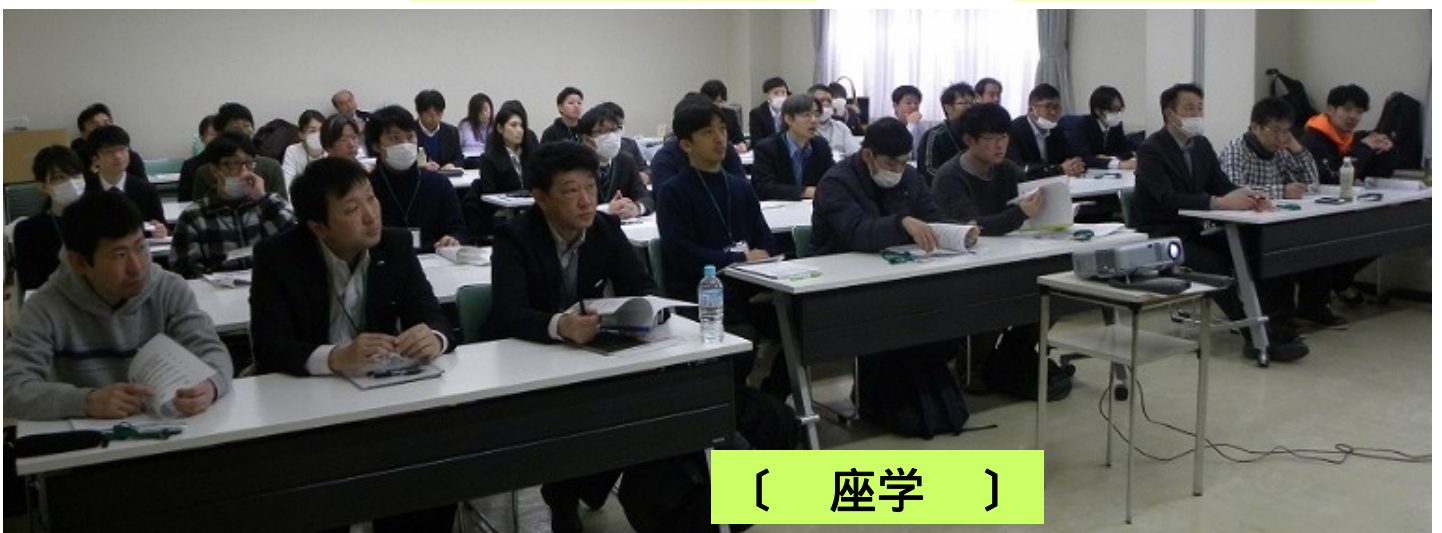
( 座学 )