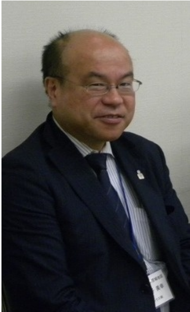
開会あいさつ (上野幹事) (次年度地区長)