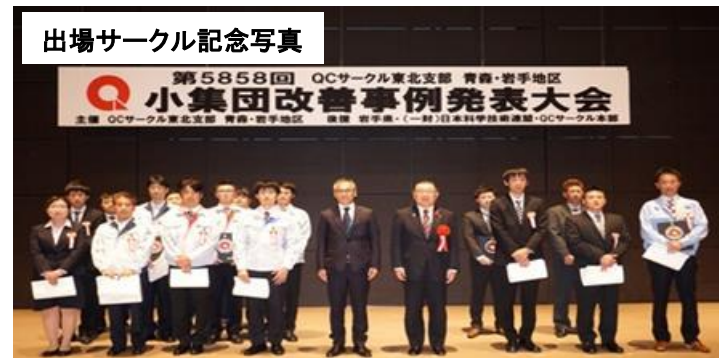
出場サークル記念写真