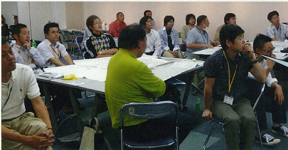
他グループからの質問です