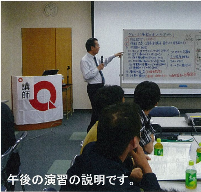
午後の演習の説明です。