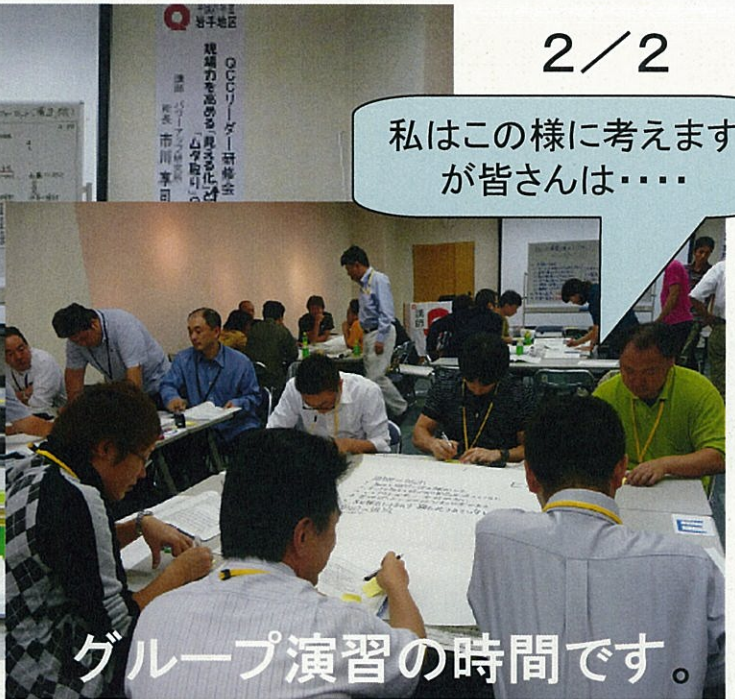
グループ演習の時間です。