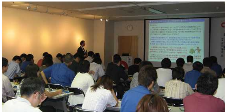
先生のノウハウが詰ったテキストで午前中の講義です。