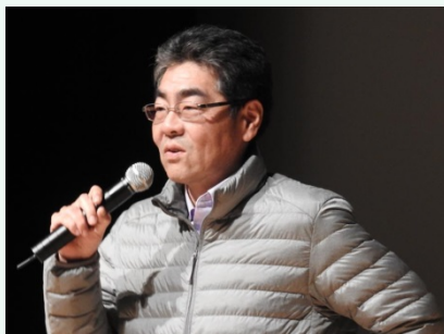
O×クイズの勝者最後の1名から一言