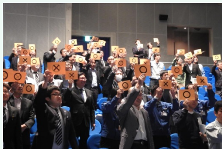
O×クイズの残り1名の選出