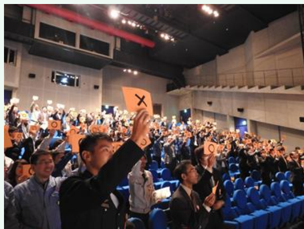
O×クイズの会場風景-2