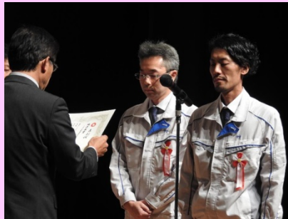
村松地区長より受賞