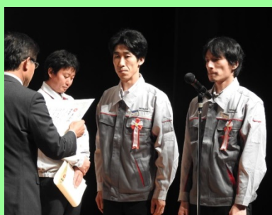
村松地区長より受賞