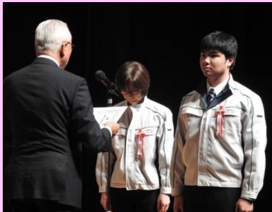
戸館部長様より受賞