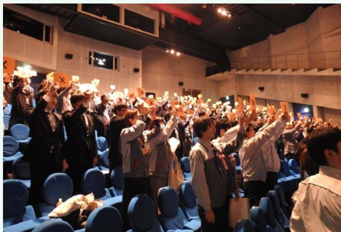
O×クイズの会場風景-1