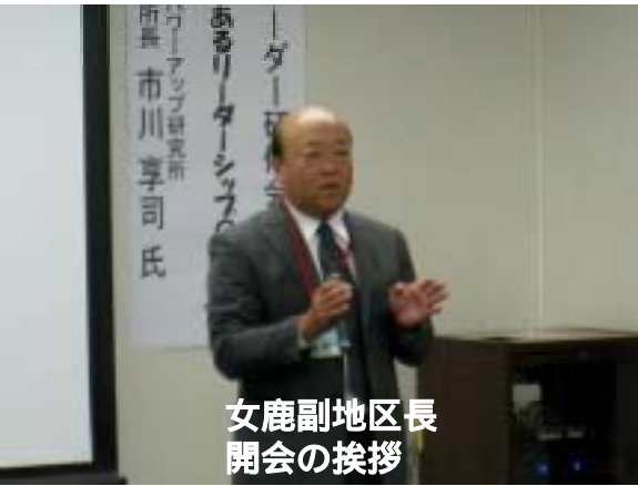
女鹿副地区長 開会の挨拶