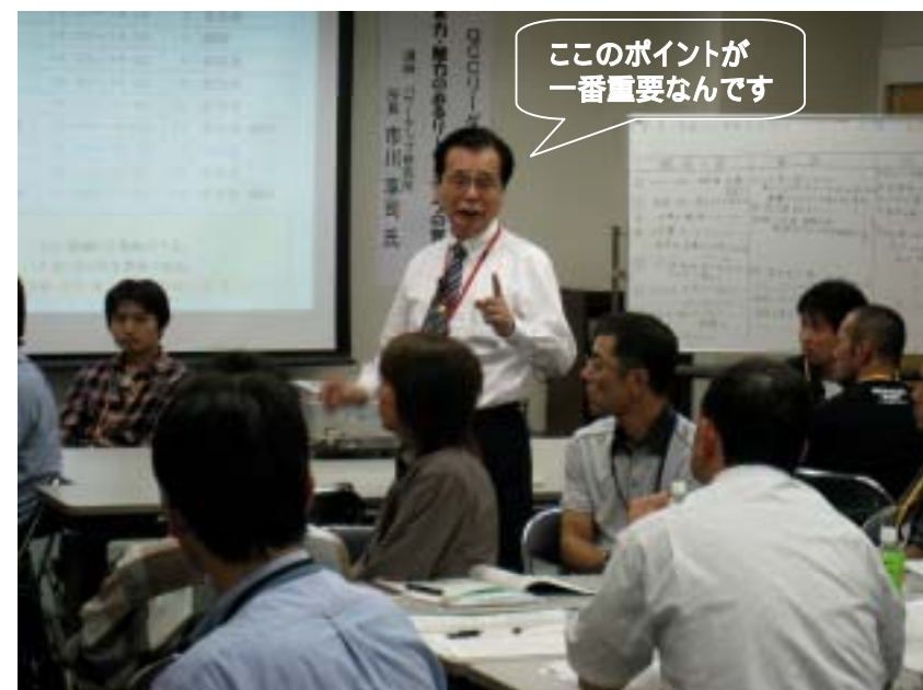
午後からはグループになって演習(グループ討議)の時間です