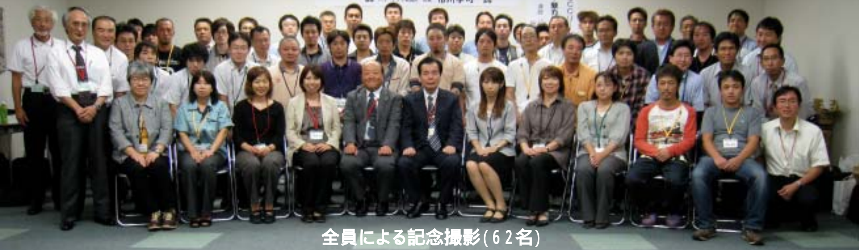
全員による記念撮影(62名)