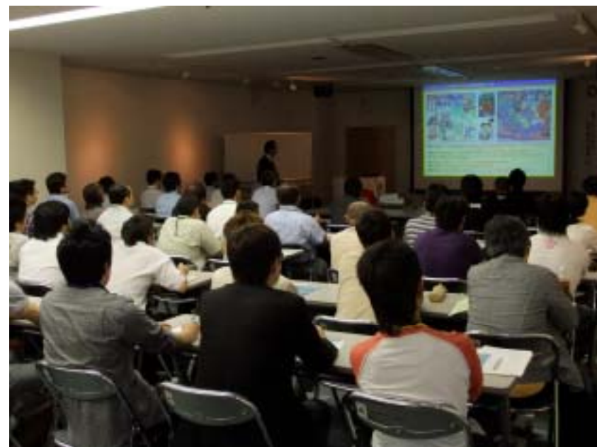
先生のノウハウが詰まったテキストで午前中は座学です