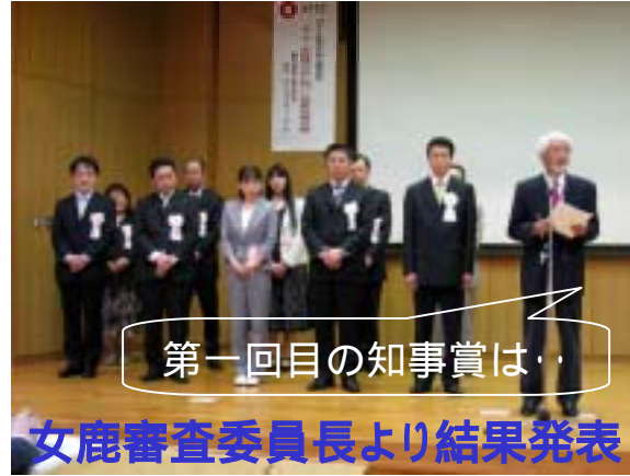
第一回目の知事賞は…