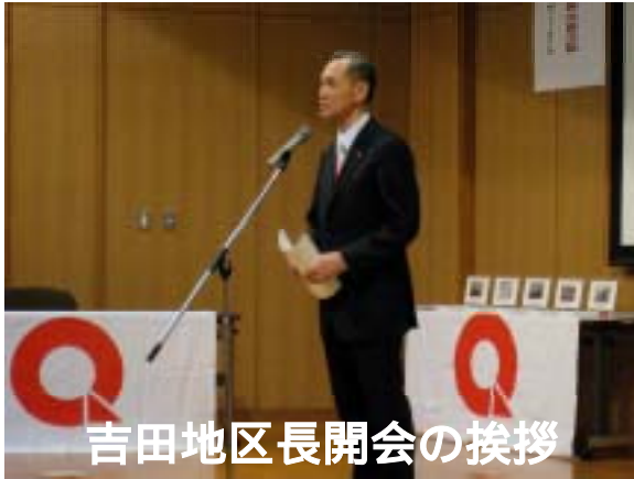
吉田地区長開会の挨拶