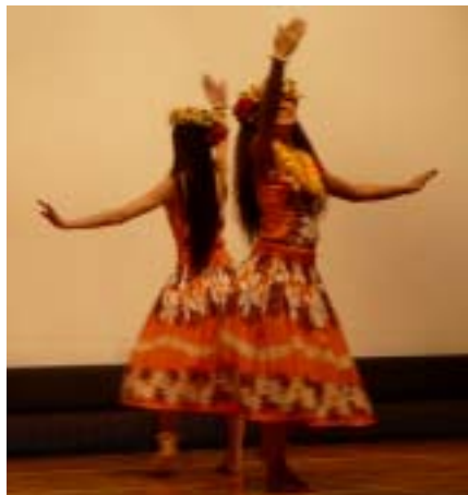
フラガールズによるフラダンスの披露