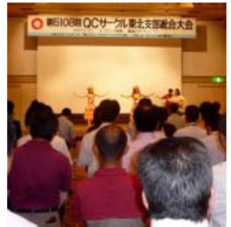
参加者全員でフラダンスの講習です