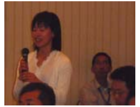
聴講者の方々の質問で盛り上がり ました