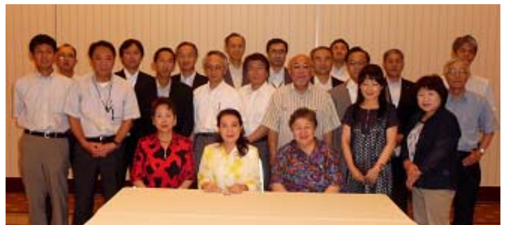
大会運営にあられた幹事・役員の方々に て記念写真