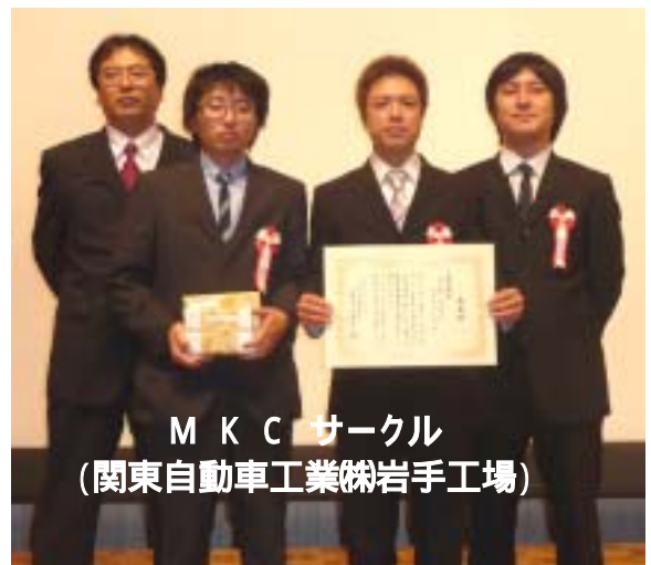
M K Cサークル (関東自動車工業株岩手工場)