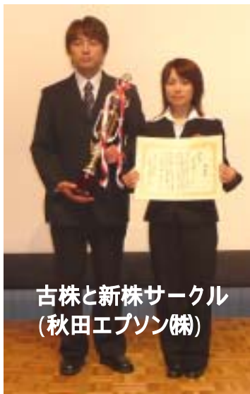
古株と新株サークル (秋田エプソン株)

発表された地区推薦 5サークル、一般公募 3サークル、選抜の部 2サークルの皆さんです