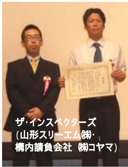
ザ・インスペクターズ (山形スリーエム株・ 構内請負会社 株コヤマ)