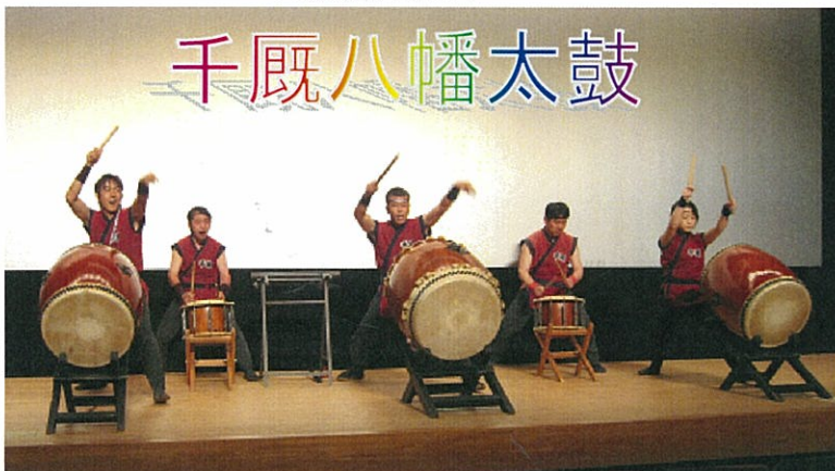
特別企画: 迫力満点 千厩八幡太鼓の皆さんによる演奏