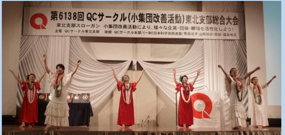
フラガールOBメンバーによる フラダンスショー