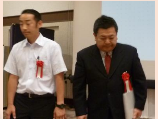
②クアーズテック(株) 小国事業所 素材サークル