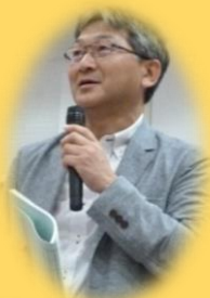
④(株)エクセディ福島