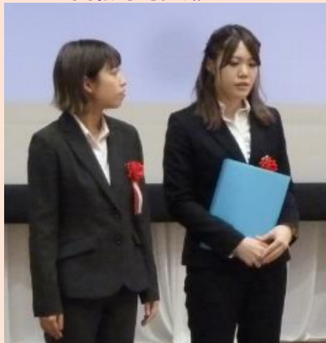
⑤日産自動車(株) いわき工場 回転寿司サークル