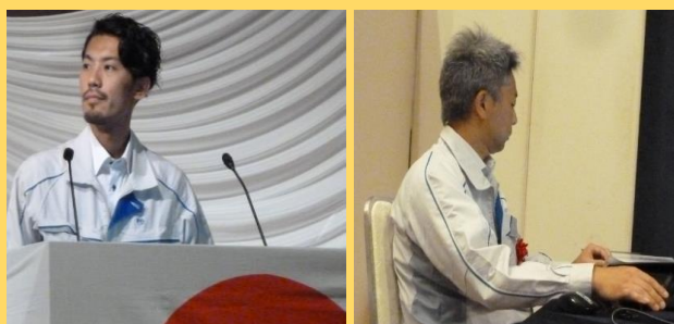
①トヨタ自動車東日本(株)岩手工場