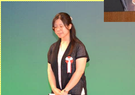
よせて、あげて、ムニユッサークル 社会福祉法人 県北報公会