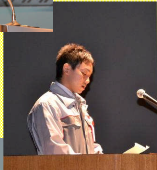
らっ苦・楽サークル 日立オートモティブシステムズ ステアリング(株) 秋田事業部