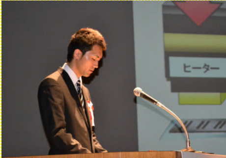
古株と新株サークル 秋田エプソン(株)