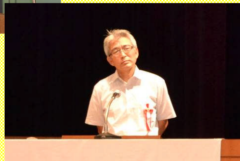
チームYAMAちゃんサークル NECネットワークプロダクツ(株)