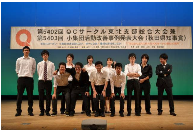
秋田県立大学の皆様にお手伝い頂きました。