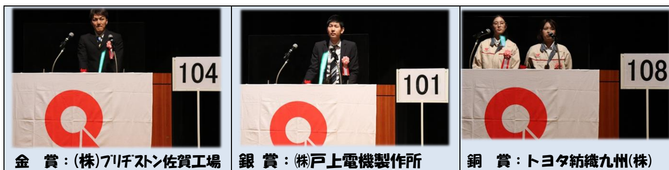
金賞：(株)ブリヂストン佐賀工場