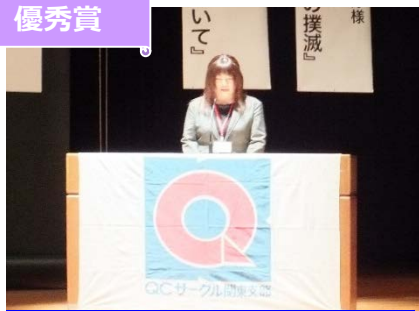
コニカミルタオプトプロダクト(株) SISETSU サークル