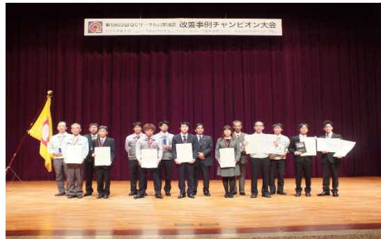
発表サークルの皆様