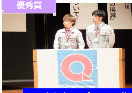
日立オートモティブシステムズ(株) モーン サークル