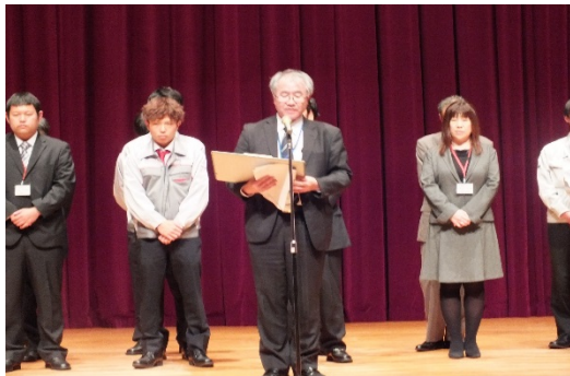
審査結果発表風景

是非、会場(埼玉会館)に足を運んでいただき、応援のほど、よろしくお願いいたします。