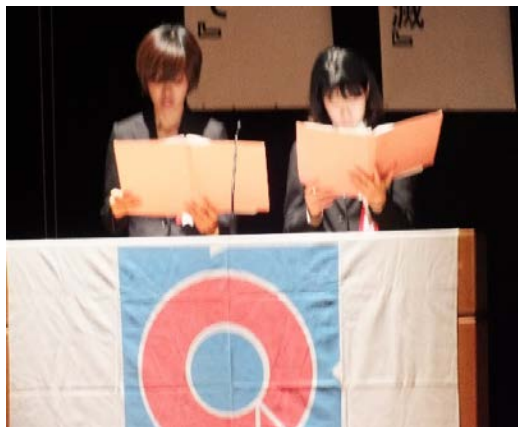
コーセル(株) THE★BEASTサークル様