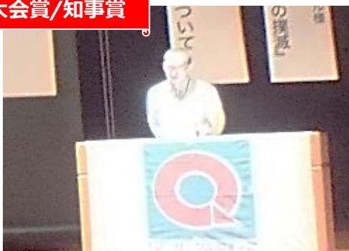
パナソニックスマートファクトリーソリューションズ(株) 受入品質向上委員会 サークル