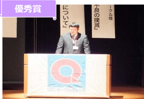
コニカミルタメカトロニクス(株) さむらい サークル