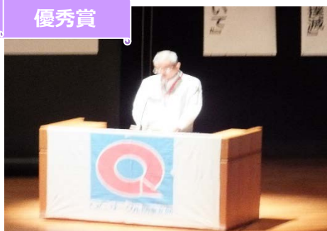
パナソニックスマートファクトリーソリューションズ(株) こーしーず サークル