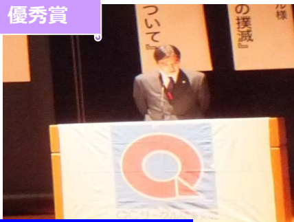
山梨積水(株) YTF サークル