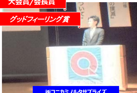
(株)コニカミルタサプライズ レインボー サークル